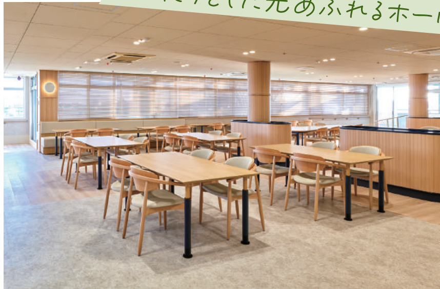
患者食堂・談話ホール（3階）

壁一面のガラス越しに眺望が広がる、光あふれるホール。患者さんやご家族はもちろん、病院職員も集う空間です。車椅子にもゆとりある設計で、食事、リハビリテーション、趣味、休憩など思い思いに過ごすことができます。「病室にいるより、あの場所に行きたい」と自然に足を運びたくなる場所になることを願っています。