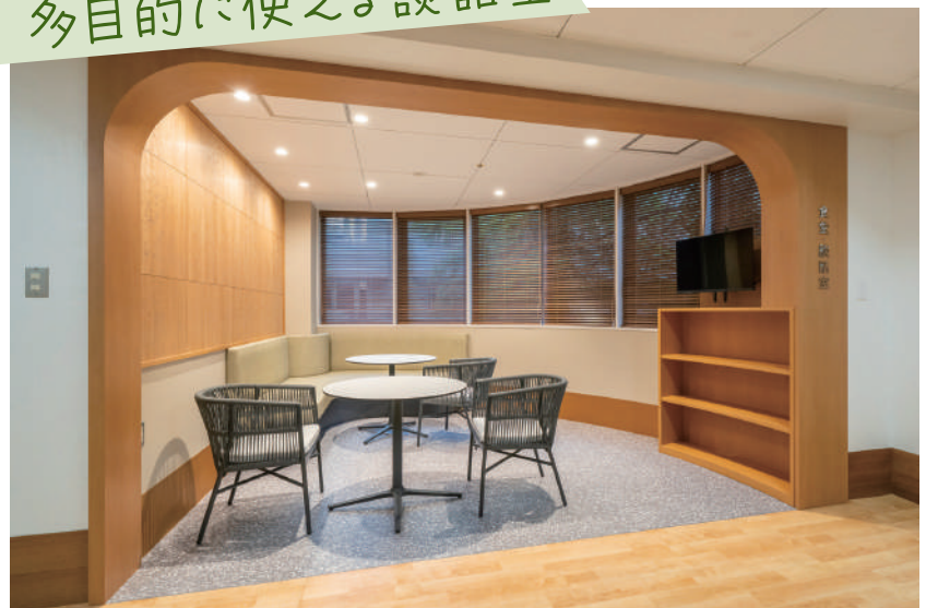
食堂・談話室（2・4階）

病棟の通路沿いに新設されたコーナー。中庭からの自然光が差し込む開放感と、自分らしく過ごせるほどよいプライベート感を両立。歩行訓練時の小休憩、ご家族との談話、読書、食事など、多目的にご利用いただけます。