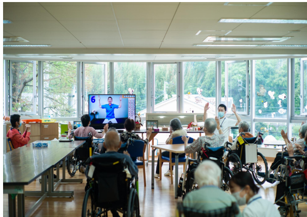
みんなで体操の時間！ 楽しみながら離床につながっています。