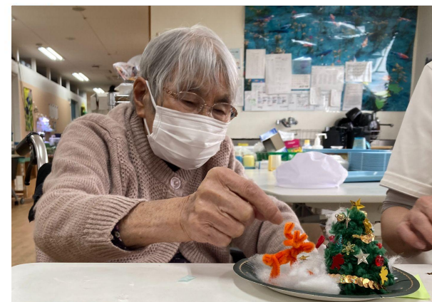
12月のデイケアの様子。自分好みのミニツリーを作りました！