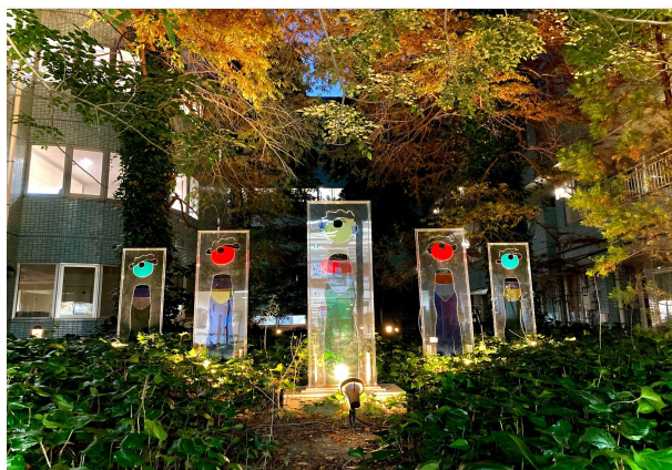
中庭の照明が灯ると、冬は幻想的な雰囲気になります。