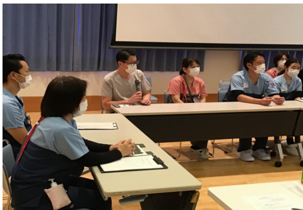
地域の病院と連携強化を目的に交流会を定期開催しています！