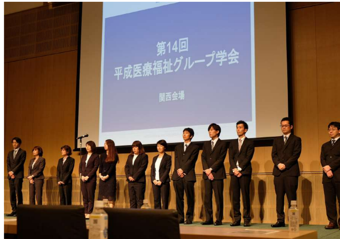
〈日時〉平成30年10月7日(日) 〈場所〉淡路夢舞台国際会議場